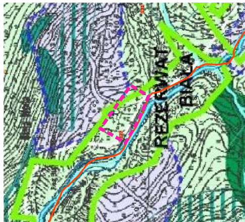
WYRYS ZE STUDIUM UWARUNKOWAŃ I KIERUNKÓW ZAGOSPODAROWANIA PRZESTRZENNEGO MIASTA I GMINY SZCZAWNICA