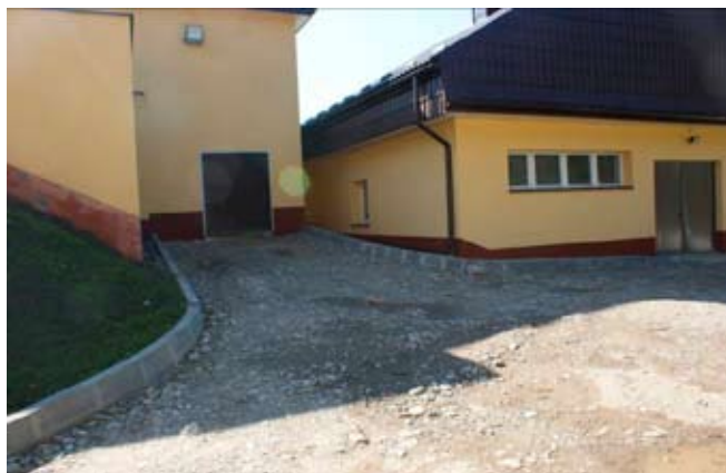
Roboty wykończeniowe na „SUW”