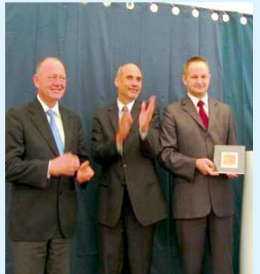
Informacje przygotował sekretarz miasta Tomasz Hurkała