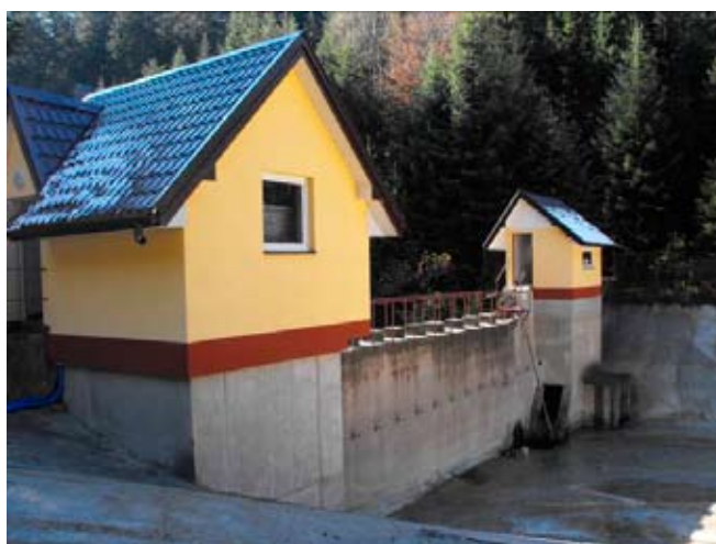
Roboty wykończeniowe na „Pokrzywach”