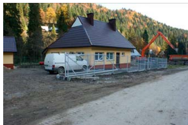
Zagospodarowanie terenu na ujęciu „Sewerynowka”