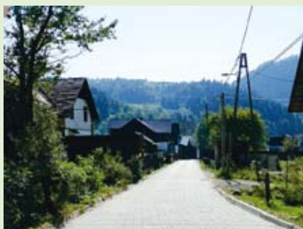
Nową nawierzchnię zyskała ulica Widok