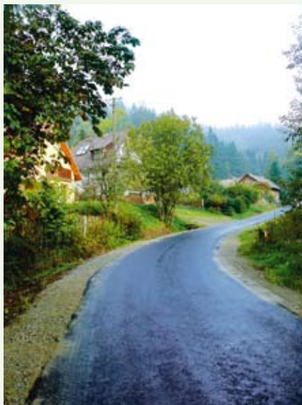
Wyremontowano kolejny odcinek ulicy Czarna Woda w Jaworkach za kwotę 170 000,00 zł