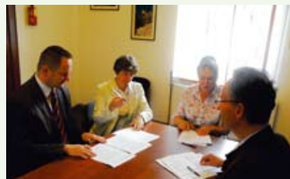
Miasto przekazało działkę pod budowę domu pomocy dla niepełnosprawnych