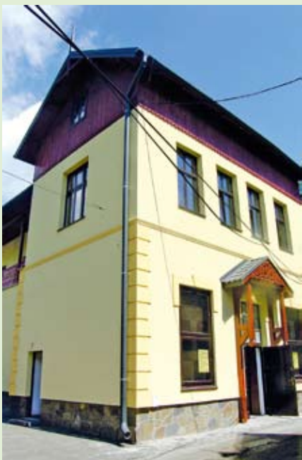
Wyremontowany został budynek Kina i oddana do użytku nowoczesna sala kinowa