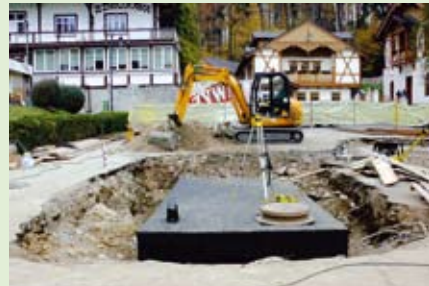
Rozpoczęliśmy przebudowę Placu Dietla i Ulicy Zdrojowej - nowa fontanna, sztuczna rzeka, piękne schody - nowymi atrakcjami Szczawnicy