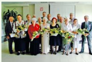
8 par w tym roku obchodziło 50-cio lecie pożycia małżeńskiego