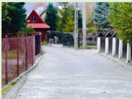
Wyremontowaliśmy ulicę Wygon