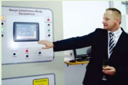
Największa i najbardziej oczekiwana inwestycja Szczawnicy. Nowe ujęcia wody i stacja jej oczyszczania zostały oddane do użytku