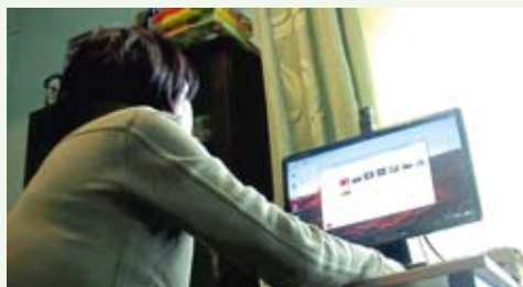
Dla 110 gospodarstw domowych Szczawnicy, Szlachtowej i Jaworek dostarczyliśmy darmowy internet i sprzęt komputerowy