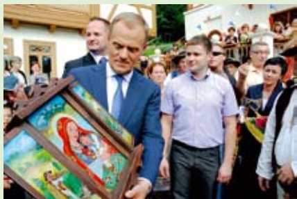
Premier Donald Tusk podziwiał szczawnicką tradycję, kulturę i sztukę