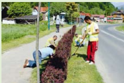
Zorganizowaliśmy prace użytecznie społeczne m.in. dla społeczności Romskiej