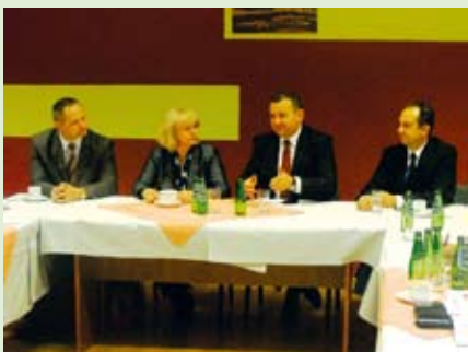
Na zaproszenie burmistrza do Szczawnicy przyjechał Minister Rolnictwa który spotkał się z samorządowcami