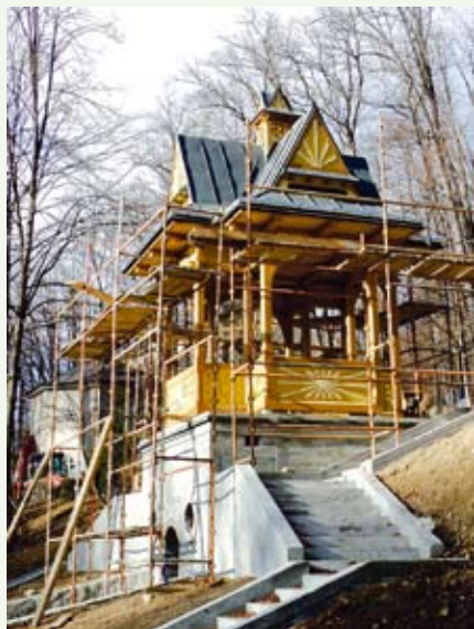
Zaczęliśmy gruntowną modernizację Parku Dolnego - altanki, ścieżki, jezioro - wszystko zyska nową szatę