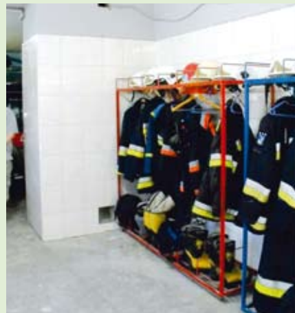
W remizie OSP wyremontowane zostały pomieszczenia