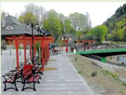
Oddana została do użytkowania najdłuższa w Polsce promenada spacerowa