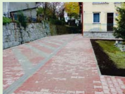
Otoczenie przedszkola zyskało nową nawierzchnię oraz wygląd