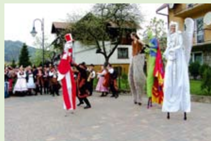
Otwarcie promenady nad Grajarkiem przyciągnęło nie tylko mieszkańców