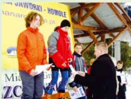
strony 3 i 4Nle zabrakło imprez sportowych takich jak m.in Zjazd Alpejski o Puchar Burmistrza