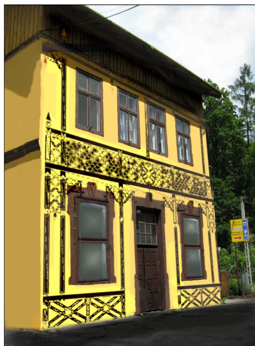
Oczekiwany stan budynku