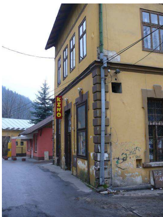
Obecny stan budynku

16. Modernizacja budynku Miejskiego Ośrodka Kultury w Szczawnicy (2009– rozstrzygnięcie przetargu i podpisanie umowy, 2010r.- realizacja inwestycji) – 1 200 000, 00 zł