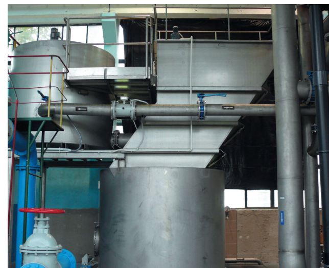
Nowe technologie - filtry pośpieszne, które będą zastosowane na stacji uzdatniania wody