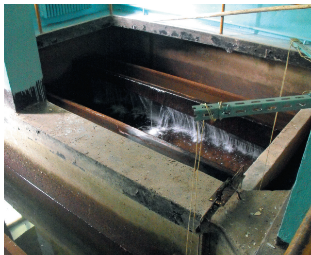
Istniejący filtr pośpieszny na stacji uzdatniania wody