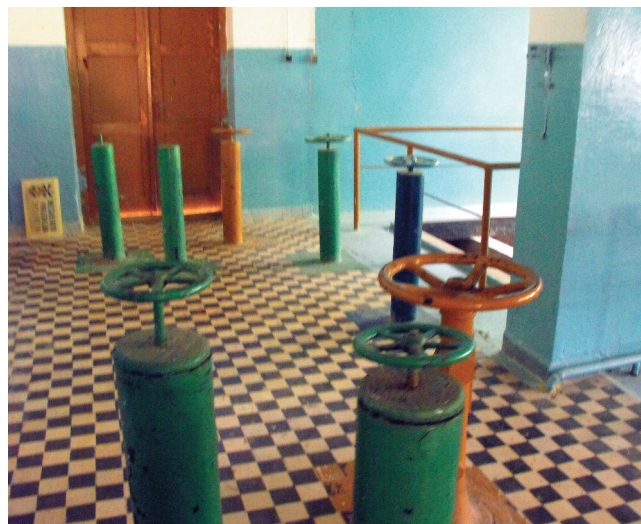
Istniejąca hala zasów