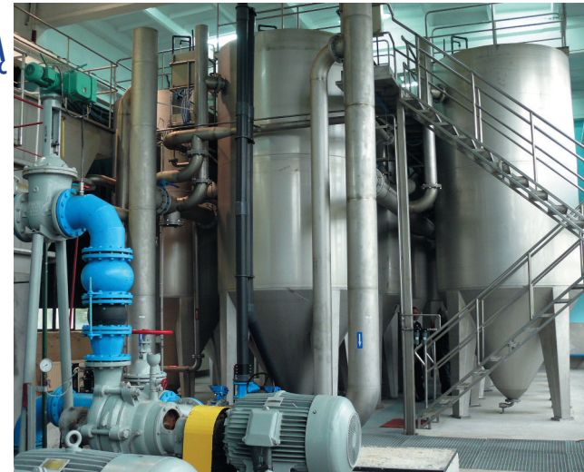
Przewidywany stan po realizacji inwestycji - nowa stacja uzdatniania wody

Działania Projektu przewidują: modernizację ujęcia wody na zbiorniku „Pokrzywy”, modernizację ujęcia wody na zbiorniku „Sewerynowka”, budowę rurociągów przesyłowych wody surowej, rozbudowę stacji uzdatniania wody, montaż aparatury kontrolno-pomiarowej i systemu sterowania. W ramach inwestycji powstaną również elementy ochrony przyrody, którymi są dwie przepławki dla ryb: na ujęciu „Pokrzywy” i na ujęciu „Sewerynowka”. Celem inwestycji jest zapewnienie dobrej jakości wody pitnej mieszkańcom, turystom i kuracjom przebywającym na terenie miasta i gminy Szczawnica