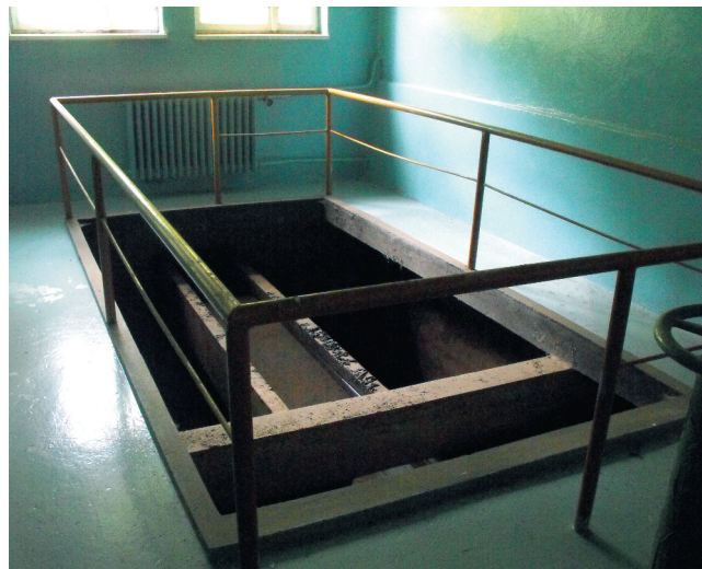
Istniejący filtr zapasowy