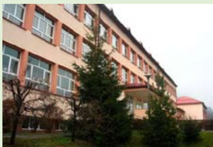
Budynek po gruntownej termomodernizacji wykonanej za kwotę 426 327,00 zł