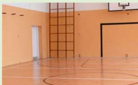
Nowa nawierzchnia i wygląd sali warte 54 472,46 zł