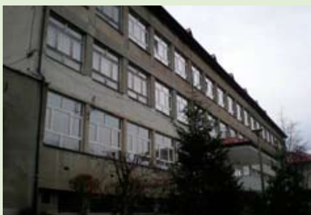
Gimnazjum Publiczne w Szczawnicy ze zniszczoną elewacją