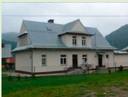
Wymieniona stolarka okienna i drzwiowa oraz odnowiona elewacja budynku o łącznej wartości 77 000,00 zł