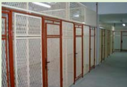
Adaptacja pomieszczeń na szatnię w gimnazjum, kwota 196 351,00 zł