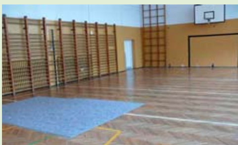
Dziurawa i zniszczona sala gimnastyczna w gimnazjum