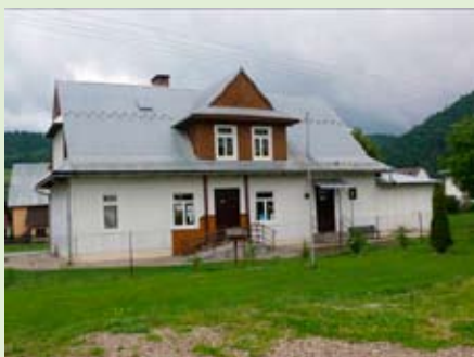
Szkoła Podstawowa w Szlachtowej ze zniszczoną elewacją